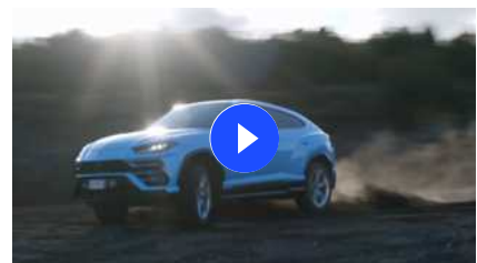
Lamborghini Urus sull'Etna

9377 - ARTICOLO NON CEDIBILE AD ALTRI AD USO ESCLUSIVO DEL CLIENTE CHE LO RICEVE