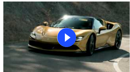
Ferrari SF90 Spider: la prova