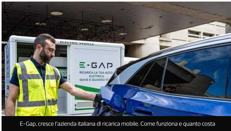
E-Gap, cresce l'azienda italiana di ricarica mobile. Come funziona e quanto costa

Il servizio di ricarica mobile on demand 100% italiano, già presente a Milano, Roma e Bologna, sbarcherà in Francia, Spagna, Germania e Regno Unito