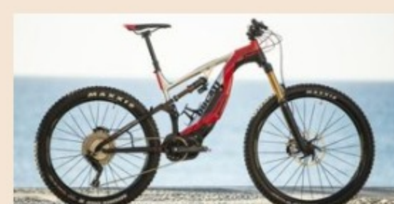
NON SOLO MOTO | 06 novembre 2018 E-bike, le bici elettriche reginette green di Eicma 2018

I “van” di E-Gap sono veri e propri centri di ricarica mobile veloce: sulle strade di Milano saranno disponibili i primi dieci, che potranno intervenire anche su prenotazione, via app o web, con una potenza di 22 o 50 kW, in grado quindi di ricaricare in modalità fast charge un parco batteria all'80% della sua capacità. A seguire il servizio farà il suo debutto in altre nove metropoli europee selezionate in base all'elevato tasso di crescita della mobilità elettrica: Roma, Parigi, Berlino, Londra, Stoccarda, Madrid, Amsterdam, Utrecht e Mosca.